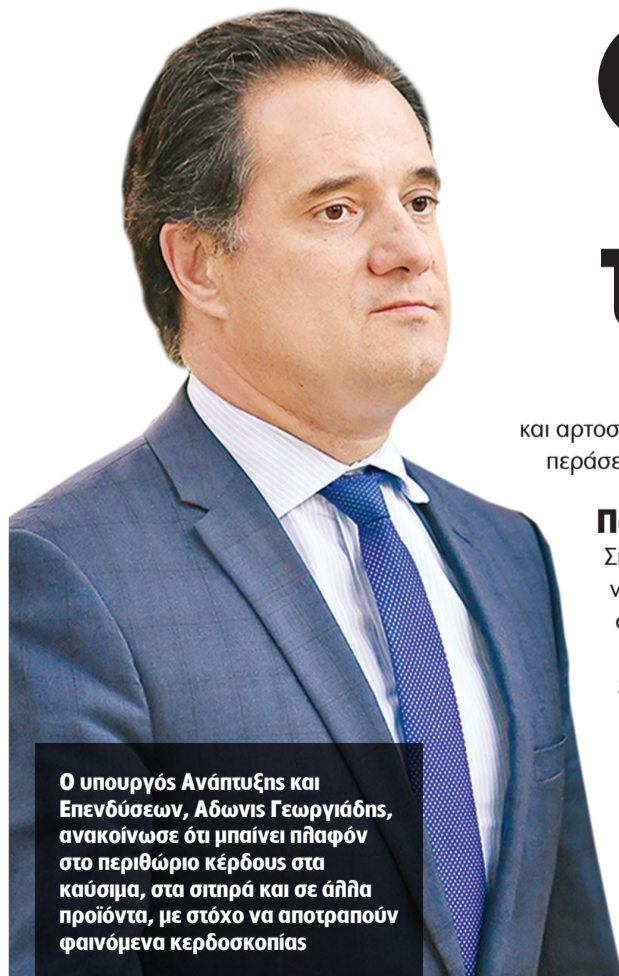
Ο υπουργός Ανάπτυξης και Επενδύσεων, Αδωνις Γεωργιάδης, ανακοίνωσε ότι μπαίνει πλάφον στο περιθώριο κέρδους στα καύσιμα, στα σιτηρά και σε άλλα προϊόντα, με στόχο να αποτραπούν φαινόμενα κερδοσκοπίας

Νέες ανατιμήσεις έως 32% έρχονται σε δεκάδες προϊόντα ευρείας κατανάλωσης από τώρα έως τον Απρίλιο. Οι τιμές αδηλάζουν σε καθημερινή βάση, αναφέρουν παράγοντες της αγοράς. Ποια μέτρα επιστρατεύει η κυβέρνηση