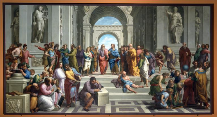
Η σχολή των Αθηνών (Ραφαήλ)